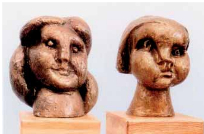
V. Koštoval – socha Hlava matka a Hlava dítě (1971)