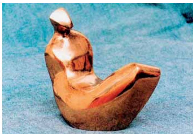
O. Drahotušský – Sedící (1965)