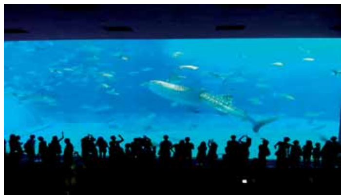
Fotografie: Mořské akvárium na ostrově Okinawa v Japonsku